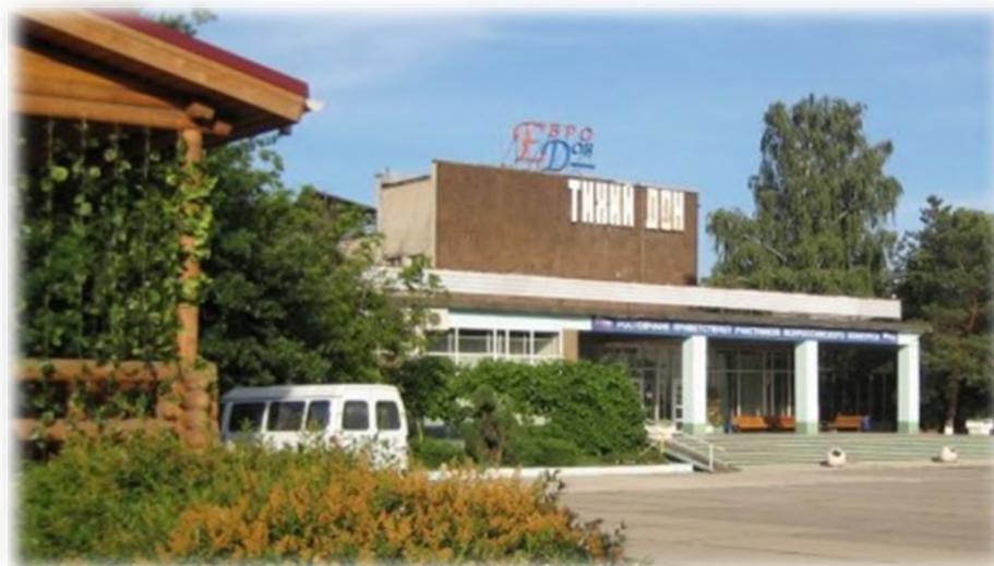
"Пансионат Профсоюзного центра с лечением "Евро-Азия-Дон"