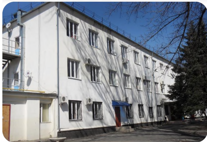
"Шахтинский пансионат для престарелых и инвалидов»