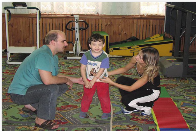
Пансионат для детей инвалидов с детства "ВИШЕНКА"