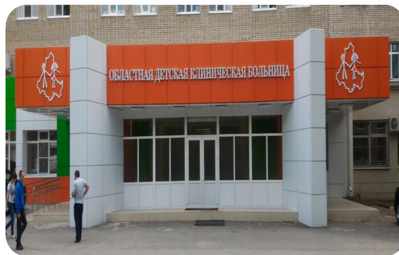
Областная детская клиническая больница