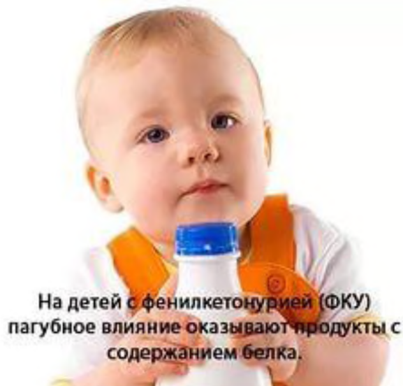
На детей с фенилкетонурией (ФКУ) пагубное влияние оказывают продукты с содержанием белка.