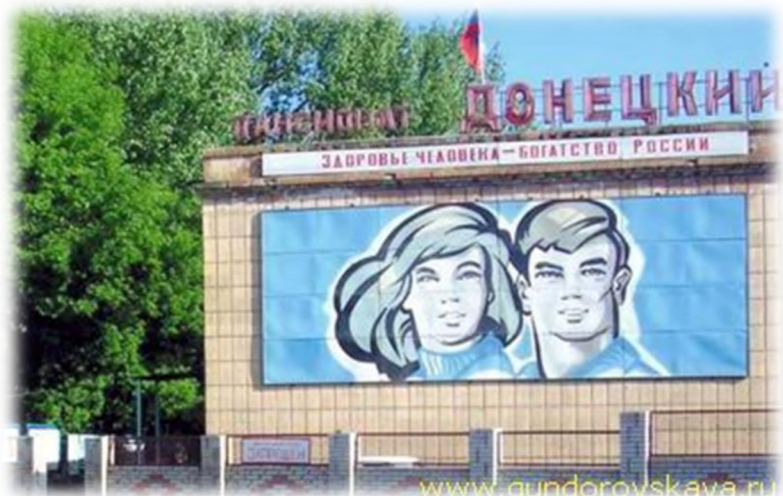
"Пансионат с лечением "Донецкий"