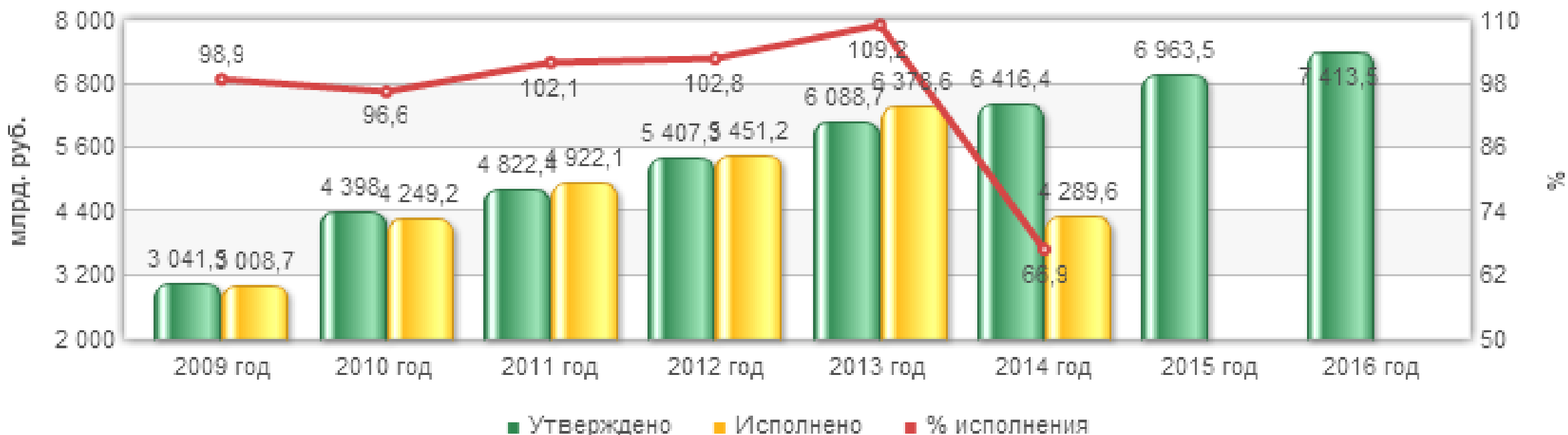
Расходы бюджета Пенсионного фонда, всего, млрд. руб.

Одной из проблем является финансовое обеспечение инвалидов в основном за счет федерального бюджета, без достаточного дополнительной поддержки со стороны субъектов государства.